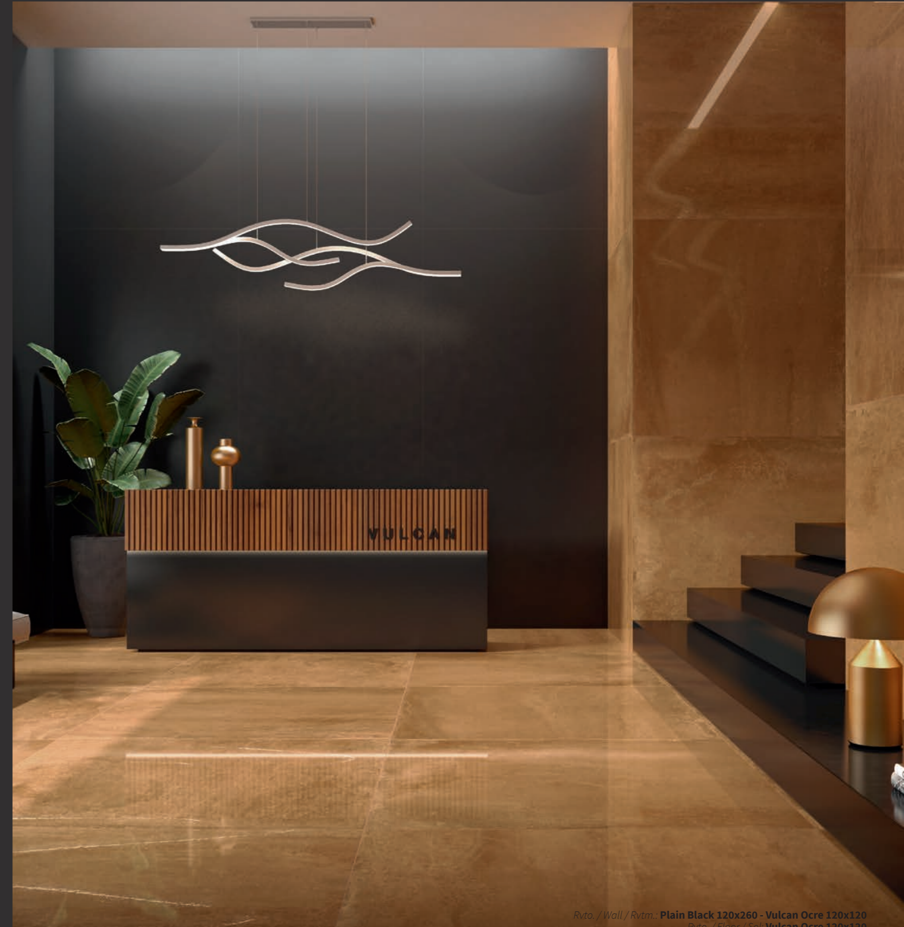
Rvto. / Wall / Rvtrn.: Plain Black 120x260 - Vulcan Ocre 120x120 Pvto. / Floor / Sol: Vulcan Ocre 120x120