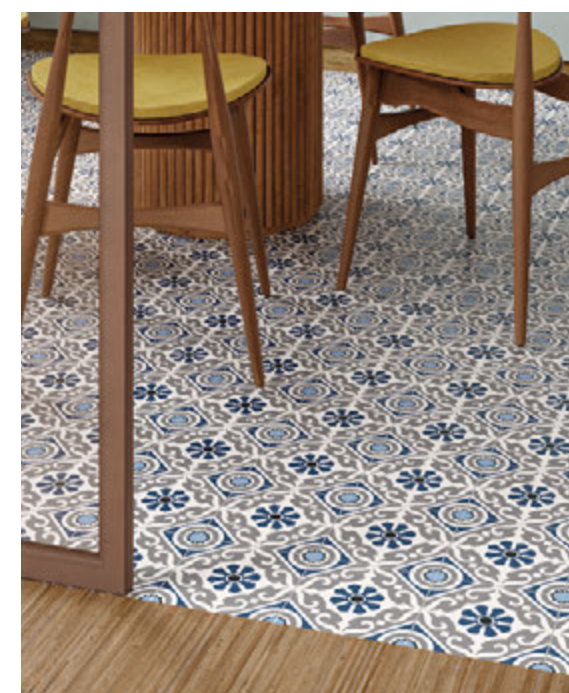
Taco Musa Blue 16,5x16,5 / 6,5"x6,5" Lama Roble Natural 20x120 / 7,9"x47,3"