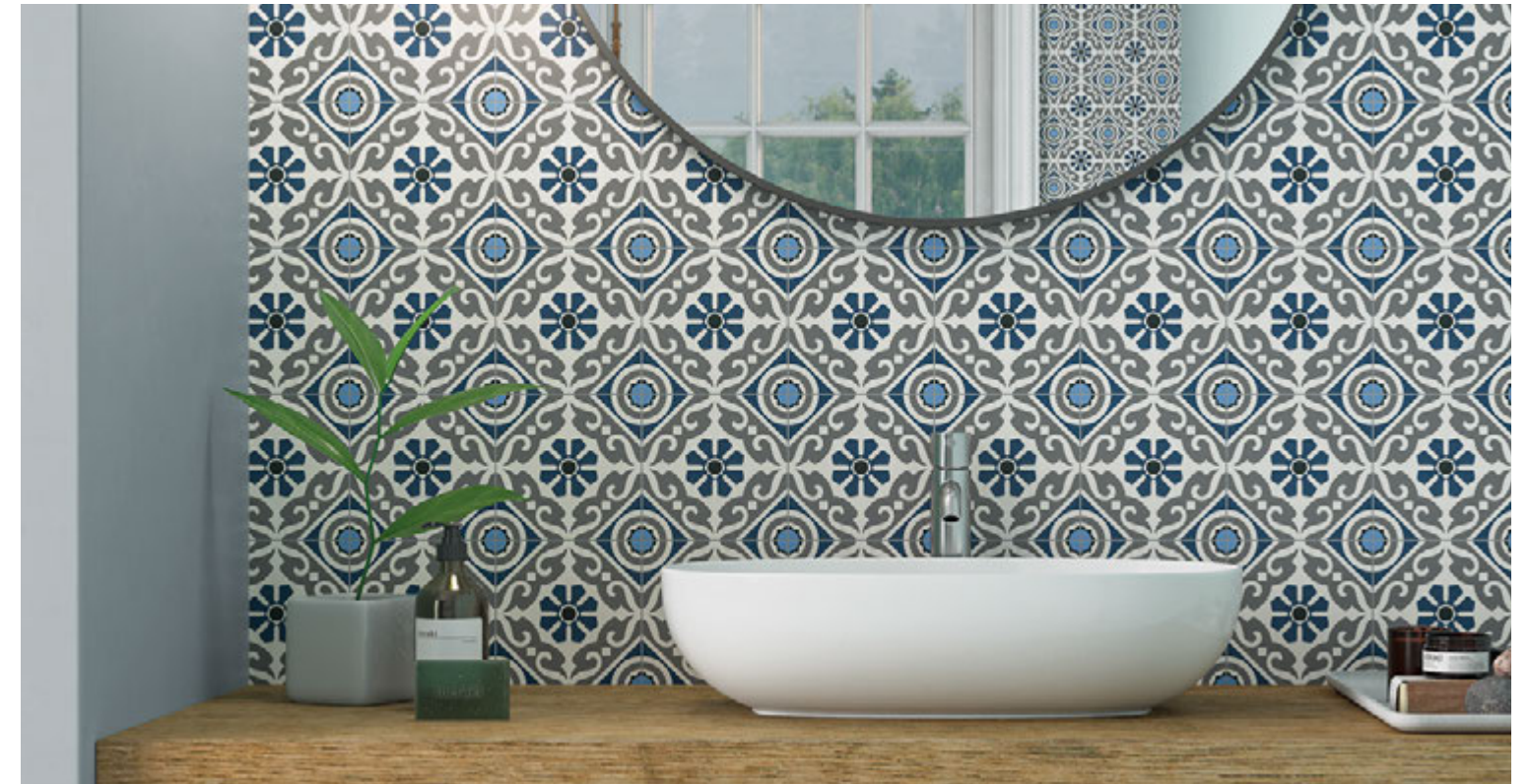
Taco Musa Blue 16,5x16,5 / 6,5"x6,5"