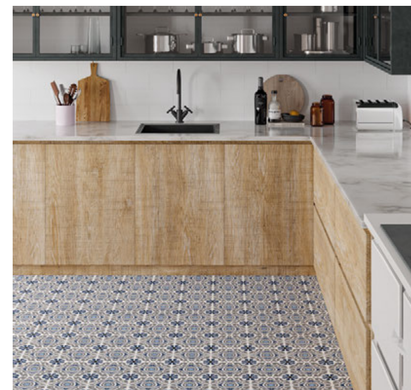
Taco Musa Blue 16,5x16,5 / 6,5"x6,5" · Brick Neutral Blanco 11x33,15 / 4,3"x13,1"