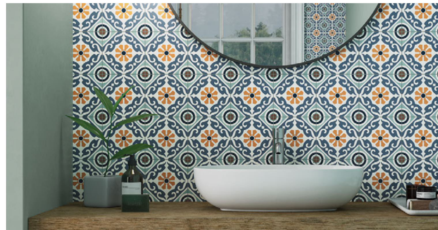
Taco Musa Mix 16,5x16,5 / 6,5"x6,5"