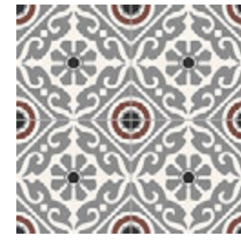
Musa Grey GF-20300D 33,15x33,15 / 13,1"x13,1"