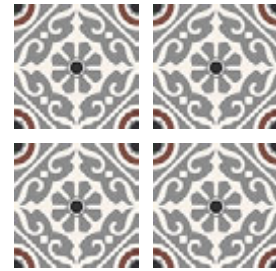
Taco GF-20305D Musa Grey 16,5x16,5 cm / 6,5"x6,5"

33,15x33,15 cm / 13,1"x13,1" 16,5x16,5 cm / 6,5"x6,5"