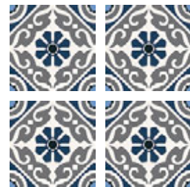
Taco GF-20305D Musa Blue 16,5x16,5 cm / 6,5"x6,5"