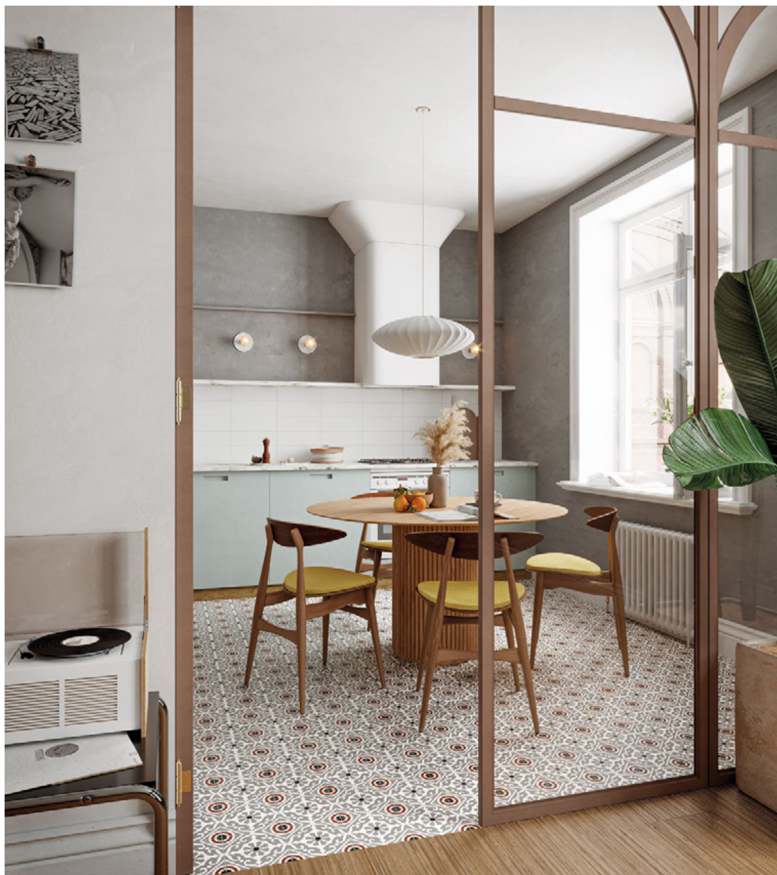
Taco Musa Grey 16,5x16,5 / 6,5"x6,5" · Lama Roble Natural 20x120 / 7,9"x47,3" · Brick Neutral Blanco 11x33,15 / 4,3"x13,1"

33,15x33,15 cm / 13,1"x13,1" 16,5x16,5 cm / 6,5"x6,5"