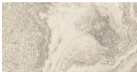
AMERICA BEIGE 62X120 24,4"X47,2"