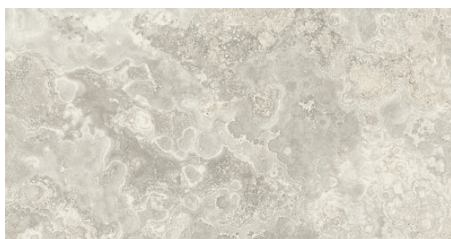
AMERICA PERLA 62X120 24,4"X47,2"